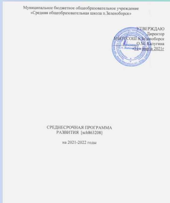
Среднесрочная программа развития [sch863208] на 2021-2022 годы

Разработка Концепции развития ОО. Разработка Среднесрочной программы развития ОО. Целевые индикаторы