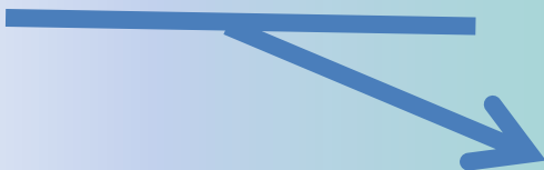
Схема организации работы школы в Личном кабинете ФИС ОКО

Отчет по подпрограмме антирисковых мер «Недостаточная предметная и методическая компетентность педагогических работников».docx